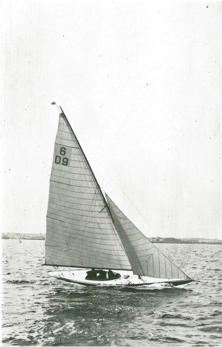
6 m. „Briand V“. Fabrikant L. Maag.