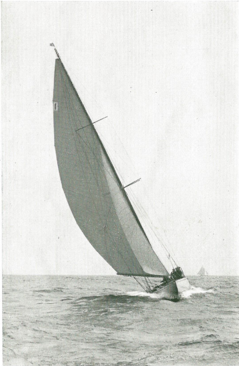
10 m. „Rita III“. H. M. Kongen.