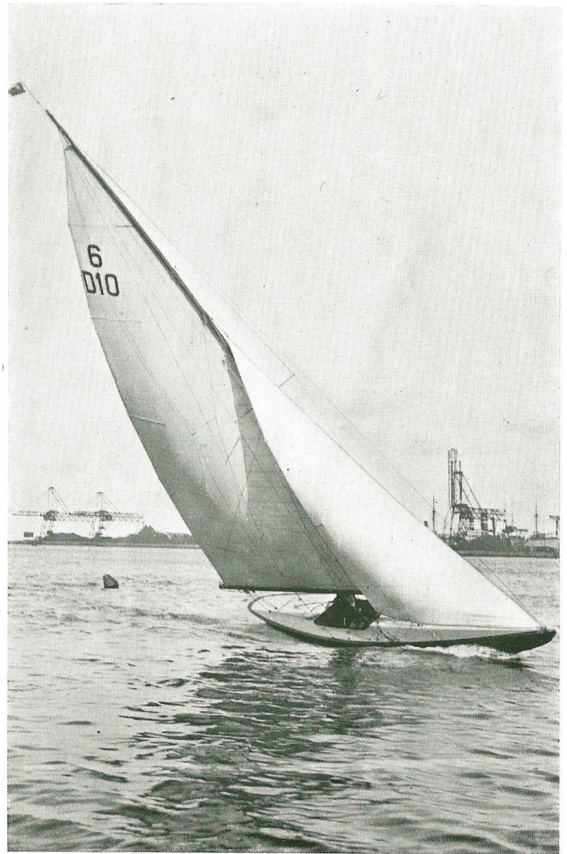
6 m. „Swan“. Arkitekt Arnold Jensen.