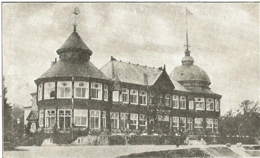
K. D. Y.'s Klubhus.