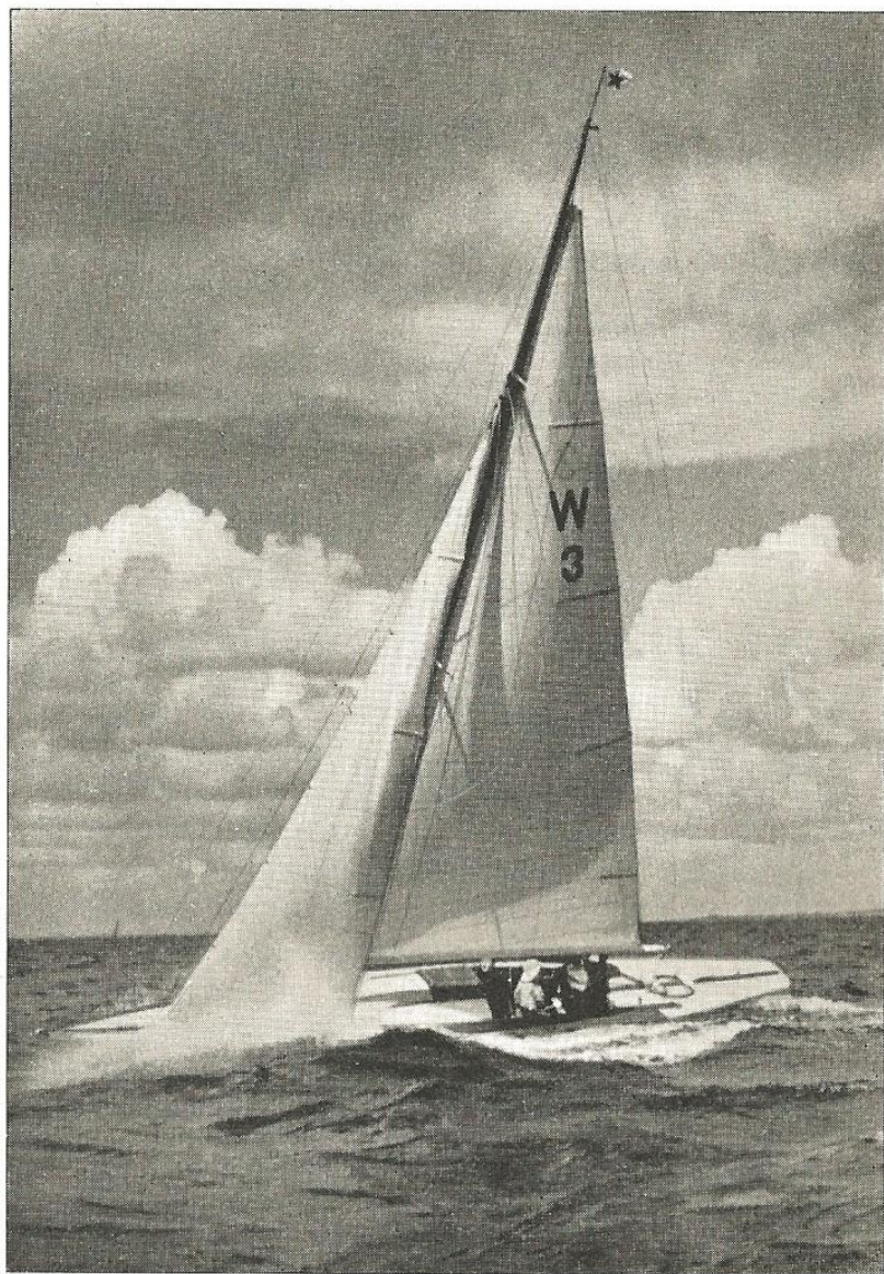
Øresundsugen 1936. W-Baaden »Columbine«.