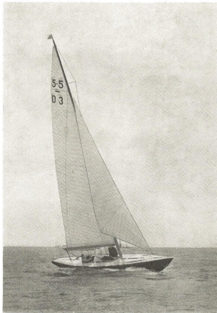
5,5 m »Trille« (tilh. Direktør Svend Illum).