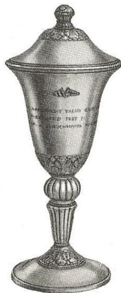
The Larchmont Yacht Club Cup