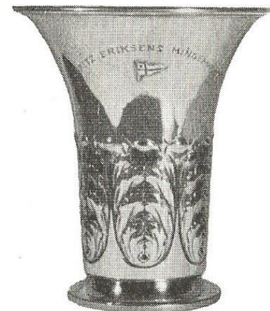
Mouritz Eriksens mindepokal