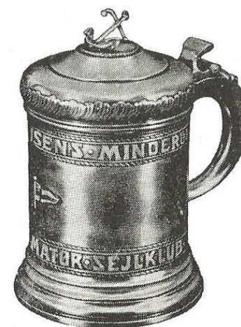
Birger Mouritzens mindepokal