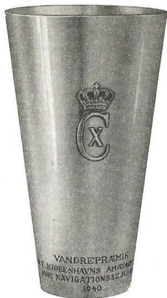
Kong Christian X's mindepokal for navigationssejls