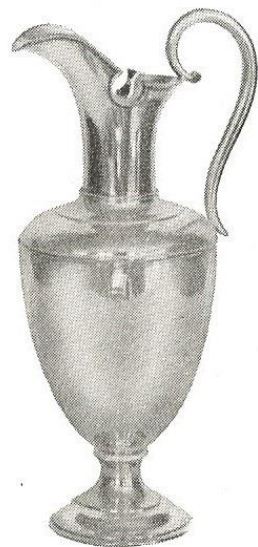
Prinsesse Margaretha pokalen