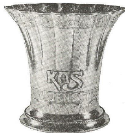
Kaj Jensens mindepokal