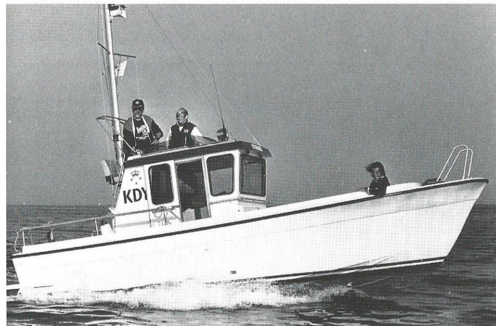
I 1988 erhvervede klubben hjælpefartøjet »Stæren«.

Statoil Yngling World Championship førte 58 deltagere fra hele verden til Danmark, og værtsnationen brillerede stort