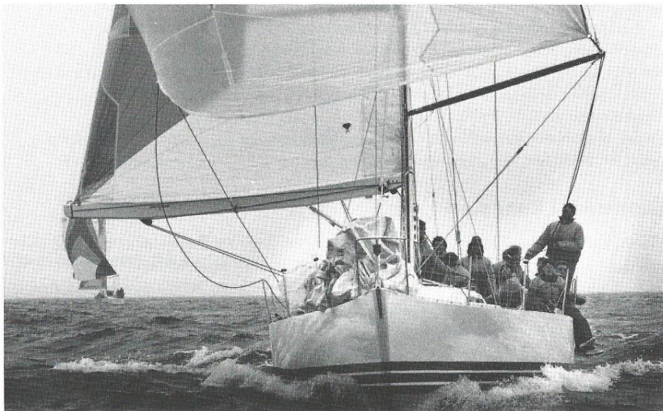
Udtagelsessejlads til Admiral's Cup.

I Kongelig Dansk Yachtklubs jubilæums-årbøger for 1891, 1916, 1941 og 1966 findes detaljerede oplysninger om foreningen fra dens start i 1866. Materialet a jourføres med KDYs årsberetninger og håndbøger. Som supplement til dette stof gengives nedenfor nogle af de vigtigste hændelser siden den forrige håndbog udkom i 1983.