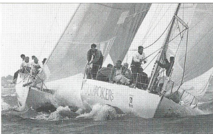
»Stockbroker's Container« vandt som eneste båd to sejladser, da Danmark i 1989 hentede sølvmedaljer ved Admiral's Cup.