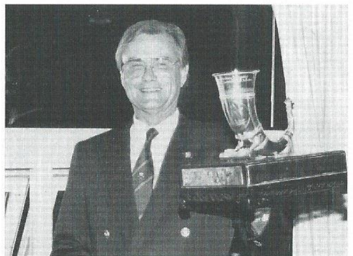
HKH Prinsen med det genvundne Prince Henrik Silver Trophy.

Royal Dragon Silver Cup fandt sted i Rungsted i samarbejde med Dansk Drageklub og Harboes Bryggeri A/S. Værtsnationen var ubeskedne nok til at vinde »Prince Henrik Silver Trophy«.